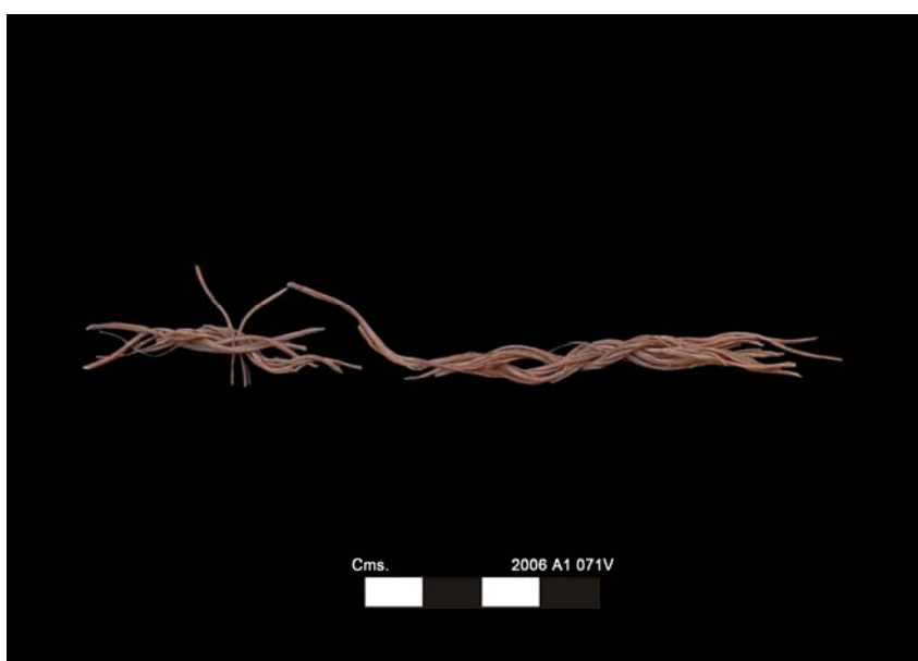
Resto de tejido vegetal Misión Arqueológica Española del I.E.A.E. Proyecto Sen en Mut, 2007

La razón para construir este edificio, de características prácticamente idénticas a las de los encontrados por Michalowsky entre las ruinas del templo de Thutmosis III, no habría sido otra que dotar al clero que debía seguir desarrollando el culto a la diosa Hat-Hor en aquel lugar, del edificio que albergase el taller de pelucas que se había desmantelado para obtener espacio para la construcción del Dyeser-Ajet.