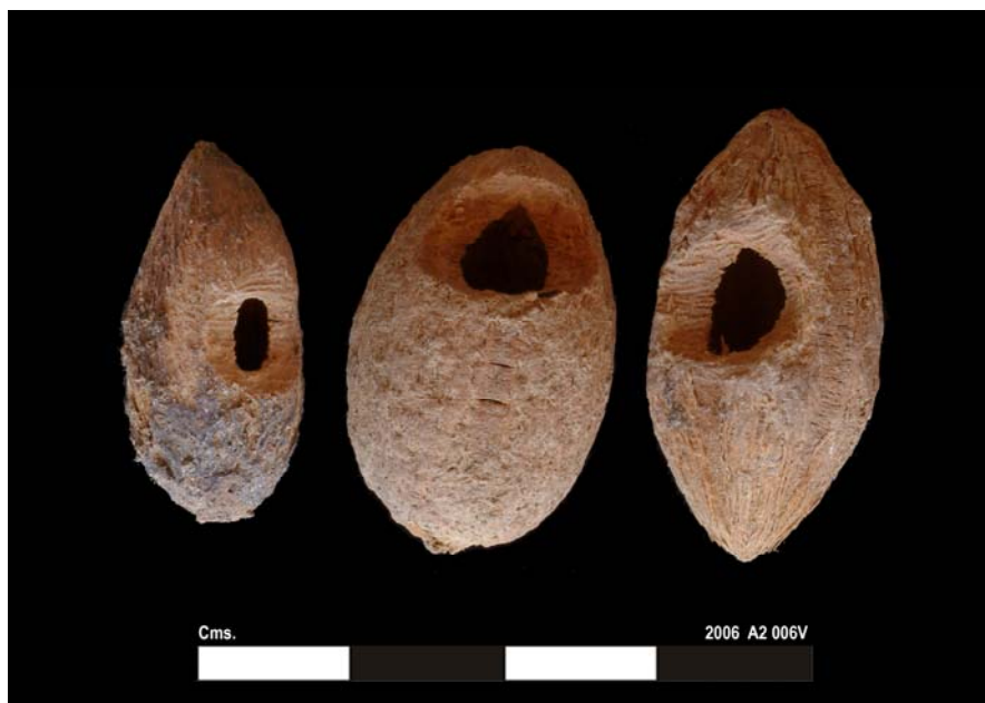
Semillas de Balanites Egiptiaca. Proyecto Sen-en-Mut TT353, 2006.