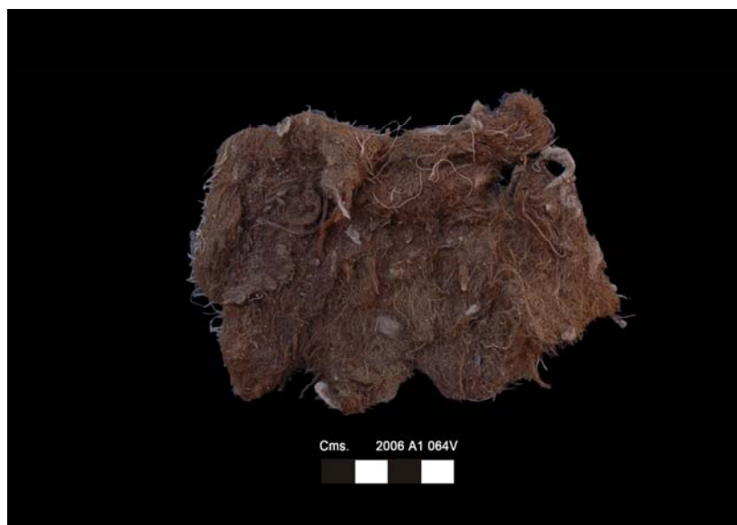
Resto de cabello. Misión Arqueológica Española del I.E.A.E. Proyecto Sen en Mut, 2007 ©I.E.A.E.